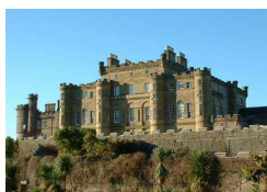
CASTELLO DI CULZEAN

La sesta edizione di “English runs in Europe” si svolgerà presso la Saint Andrews University (nei pressi di Edimburgo), la più antica ed importante università scozzese, tra le più note e prestigiose di tutto il Regno Unito (nota anche perché vi ha condotto gli studi universitari il principe William), ove si terranno corsi intensivi di lingua inglese, nell’arco di due settimane (dall’8 agosto al 22 agosto 2010) .