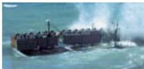
Test Nelle acque di Reggio Calabria

Un chilometro di diga a cassoni in cemento armato produce in media 6-9 mila MWora all'anno nel Mediterraneo contro le 66 mila MWora in California (con onde alte due metri). Questa fonte rinnovabile incorporata in uno sbarramento piace a Renzo Piano che pensa di inserirla nel nuovo porto di Genova. Piace pure all'emirato di Dubai e al Belgio che la